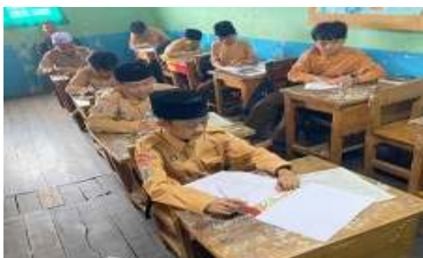
Gambar 4.2. Pretest Pada Kelompok Kontrol Dan Intervensi

kemampuan berpikir kritis (Ruri Yuliani dan Moh Fathurrahman, 2025; 26–36.). Rentang nilai yang begitu jauh juga mengindikasikan bahwa sebagian siswa memerlukan strategi pembelajaran yang lebih efektif dan terarah untuk membantu mereka memahami materi secara mendalam.