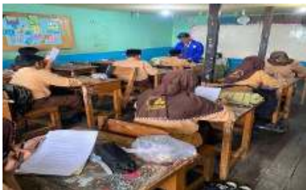
Gambar 4.3. Posttest Pada Kelompok Kontrol Dan Intervensi

yang lebih baik secara keseluruhan dibandingkan dengan siswa di kelompok control (Respati Pandu et al., 2023; 127–134).