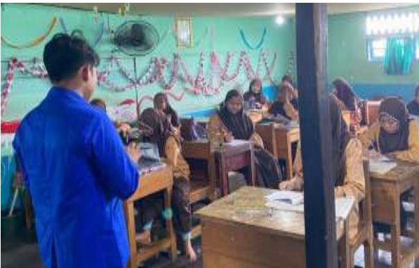
Gambar 4. 4. Pembelajaran Dengan Menggunakan Booklet CERMAT Pada Kelompok Intervensi

siswa/siswi. Booklet CERMAT dirancang untuk membantu siswa memahami materi secara lebih mendalam melalui penyajian informasi yang sistematis, ilustratif, dan kontekstual sehingga dapat merangsang pola berpikir logis dan analitis sesuai tuntutan pembelajaran abad ke-21 (Dede Kurnia Adiputra, dan Nurul Hidayah, 2025; 28).